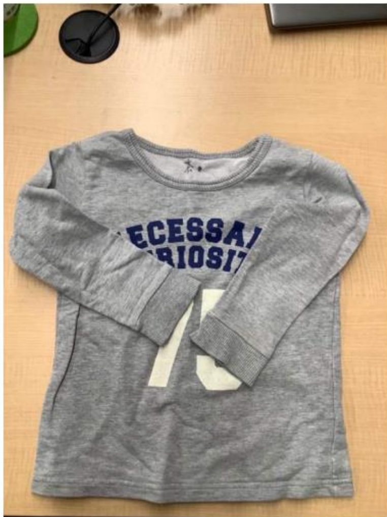
トレーナー・Tシャツ